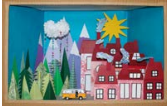
Micheline Grivel Sorand

Pour le plaisir des yeux : voici le nouveau diorama qui égaye la cheminée du salon !