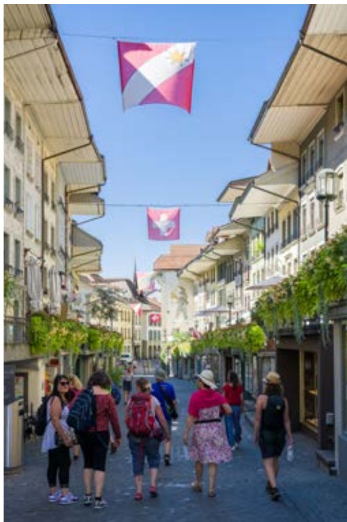
Photo de la grande sortie d'été 2020